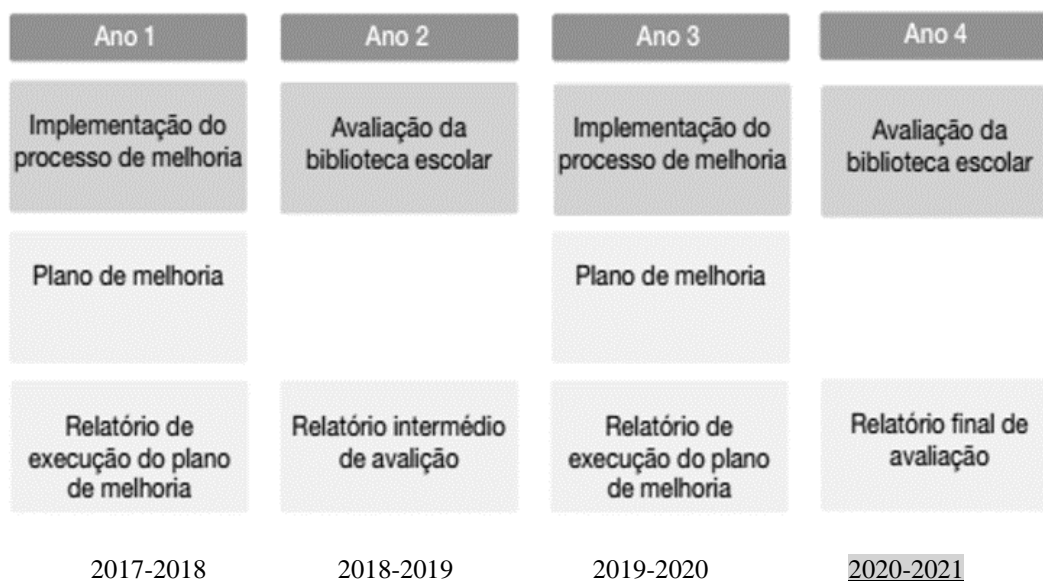
Figura n.º 1 – Etapas do ciclo de avaliação

A avaliação das Bibliotecas Escolares (BE) tem como objetivo determinar até que ponto a missão, as metas e os objetivos estabelecidos para as bibliotecas estão ou não a ser alcançados, identificando as práticas que têm sucesso e que deverão manter-se e os pontos fracos que importa melhorar.